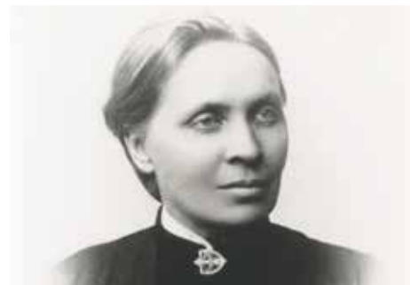
Elfrida Andrée, Sveriges första kvinnliga domkyrkoorganist

ingen SKO (Sveriges kvinnliga organister) en rapport som tydligt visar att vi har mycket kvar att göra för att uppnå jämställdhet. SKO har inhämtat statistik från de fyra musikhögskolorna (Piteå, Göteborg, Stockholm och Malmö) och från landets samtliga stift. Siffrorna är tydliga! Sedan vår första kvinnliga domkyrkoorganist tillsattes år 1867 (Elfrida Andrée i Göteborg) har endast ytterligare fyra kvinnor fått en domkyrkoorganisttjänst.