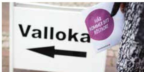
Kyrkoval hålls vart fjärde år

Före pandemin bestämde vi kyrkomusiker oss för att lyfta fram kvinnliga tonsättare under ett helt år (!) och vi tänkte göra det året 2021 då vi firade att den allmänna rösträtten i Sverige hade funnits i 100 år. Den allmänna rösträtten innebar att alla kvinnor men faktiskt även alla män för första gången fick möjlighet att påverka samhället genom att man fick lägga sin röst (med några undantag som togs bort 1922 och 1945). Ekonomi och kön blev i det sammanhanget oväsentligt. Vi är alla lika mycket värda, och våra röster är lika mycket värda! Eller...? Hur är det egentligen med det? Vad hände detta år? Vad har hänt med oss efter detta år?