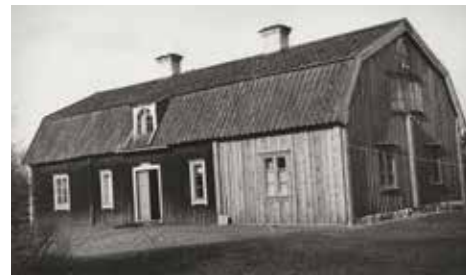
Sockenstugan före renoveringen

Det hela började med två byggprojekt. Församlingens kyrkoråd hade fattat det framsynta beslutet att köpa in den gamla sockenstugan i syfte att få lokaler för församlingsverksamheten. Den andra söndagen i advent år 1983 invigdes Sockenstugan efter omfattande renoveringsarbete. Kyrkorådet hade också beslutat att inköpa det gamla ålderdomshemmet alldeles intill för att från och med den 8 mars år 1984 kunna använda som pastorsexpedition och tjänsterum för personalen. Detta innebar att församlingsarbetet fick ett nytt centrum på kyrkbacken, helt nära den medeltida kyrkan.