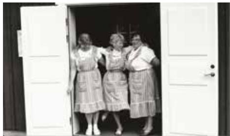
Damer i förkläden

och man höll öppet i Sockenstugan varje dag mellan klockan 10 och 14 under två veckor i slutet av juni. Det serverades kaffe men ännu inga våfflor. Man sålde u-landsvaror och hade bokbord med tillhörande läsrum. Visning av kyrkan erbjöds och man fortsatte senare under sommaren med öppet hus i Sockenstugan vissa vardagar mellan klockan 17 och 19. Under de två egentliga ”vägkyrkoveckorna” kom runt 350 personer den första sommaren för att serveras av församlingens damer i blå förkläden.