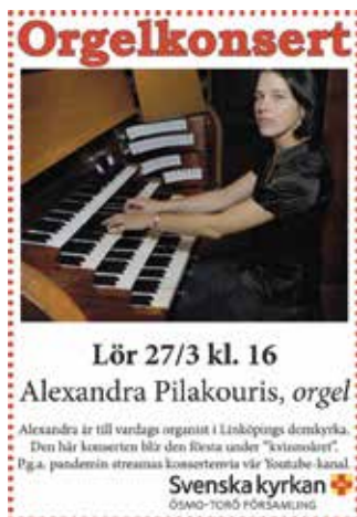
Exempel på konsert från 2021

som framförs av våra körer är skriven av både kvinnor och män, både nu levande och historiska. Bjuder vi in organister att spela orgelkonsert är vårt motto "varannan damernas", så att vi inte fortsätter att fastna i gamla hjulspår och bara bjuda in män - kvinnor kan också spela orgel (om nu någon trodde något annat)! När vi bjuder in artister att spela och sjunga vid våra sommarkonserter påpekar vi numera alltid att vi förväntar oss ett program som inte bara ger röst åt de döda vita männen (som för övrigt är kraftigt överrepresenterade i konserthus och på kulturscener). De allra flesta uppskattar vårt initiativ, och gör sitt yttersta för att presentera en blandad repertoar.