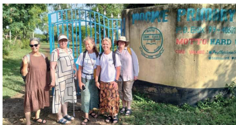
Lärarna från Sverige

Äntligen var det dags att åka. Vaccinerad och med malariamedicin i handbagaget gick jag genom biljettspärren på Arlanda. Jag hade aldrig tidigare flugit så långt, först 7 timmar till Doa, efter det 7 timmar till Nairobi och sedan en dryg timme till Kisumu. Resan gick enligt plan och jag klev ut i värmen i Kisumu. Där träffade jag de andra lärarna och det var dags att åka buss till Wagwe. Men först ett stopp vid bankomaten och affären för att bunkra. Det går åt en hel del vatten och toapapper för 16 lärare under två veckor. Under resan till Wagwe åkte vi förbi många små byar med många människor som vinkade åt oss. Längs med vägarna gick kor och getter och betade.