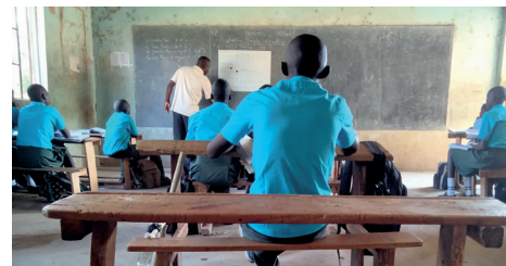
Lektion i Wagwe