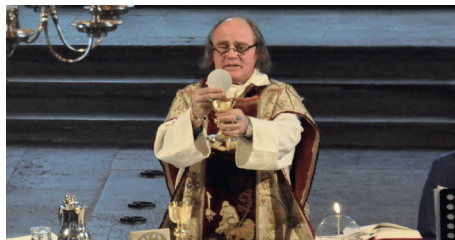
Högmässa i Ösmo kyrka

hemlighet yppad under tystnadsplikt ska halshuggas. Visserligen avskaffades dödsstraffet 1912, vilket gjorde Sverige till ett civiliserat land. Men man glömde kyrkolagen... Jag har ju huvudet kvar, och både 1993 och 2000 fick vi nya kyrkolagar.