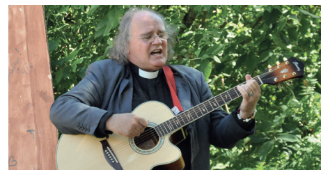
Trubadur på vägkyrkan

Alla samtal med dopfamiljer, vigselpar och sorgehus. Undervisning på många olika nivåer och torsdagskvällarna tillsammans med ungdomarna. Så många gånger har det hänt att jag släpat mig dit, trött och sliten, för att tre-fyra timmar senare studsa hemåt i glädjen över all den energi och kärlek som unga människor utan att tänka på det delar med sig av. Alla samtal, de där gångerna jag "bara" skulle ner till centrum och köpa en liter mjölk och kom hem efter ett par timmar för att någon eller några ville prata. Lägg märke till att detta sista är allt annat än ett klagomål – det är en del av församlingsprästens viktiga liv som kanske inte alla är medvetna om. Och – ifall ingen anade det – arbetskamraterna! Den dagliga fikastunden som just för att den är så kravlös har framfört många kreativa idéer om vad vi vill göra av våra uppgifter. Detta var ett taffligt och kortfattat försök att tala om hur underbara tio år jag haft här.