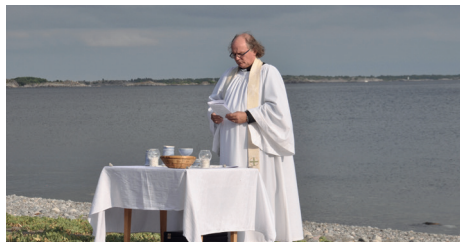
Gudstjänst på Stenstrand

det och sinnet vill jag gärna ånga på in i framtida löftesland, men kroppen är trött. Det är dessvärre bara att konstatera. Och på något sätt unnar jag er unga i församlingen att få någon yngre präst att tampas med. Någon som kanske till och med är kunnig i den digitala värld som alltmer lämnar mig utanför i diverse sammanhang. Jag är helt enkelt inte intresserad.