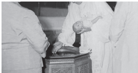
Allans dop, Mikaelidagen i ?? kyrka

Utan att på något sätt jämföra mig med Mose och hans bedrifter kom jag att tänka på den här berättelsen när jag såg vilken bild som finns på framsidan av detta församlingsblad. Jag står med en utflyktsryggsäck och skådar in i skogen från en klipphöjd... Jag ser in i den ovissa framtid som kallas pensionärstillvaron och måste erkänna att jag känner mig väldigt osäker. Jag har ju aldrig gått i pension förut och vet liksom inte riktigt hur man gör. För att återknyta till berättelsen om Mose är det ju faktiskt så att jag har kommit till den punkt där jag inte får/kan/vill följa med längre. Visst kommer ni att se mig i församlingen igen – som vikarie då och då; Gud har inte lämnat några antydningar om att jag ska begravas än på ett tag. Men när jag kommer igen är jag en gäst, och det är ofrånkomligt.