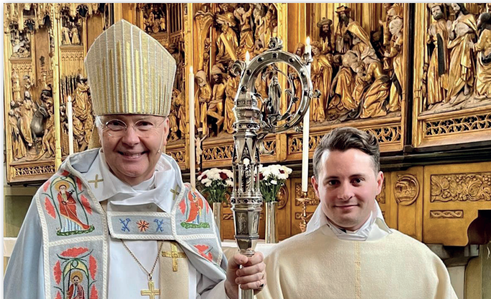
Prästvigning i Strängnäs domkyrka.