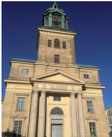
Domkyrkan i Göteborg