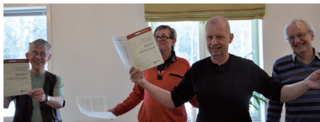
Vi längtar efter att få ses fysiskt!

Ni undrar kanske vad kyrkokören gör nu när vi inte kan träffas fysiskt och sjunga tillsammans? I början av hösten delade vi upp kyrkokören i tre grupper som träffades var och en för sig under corona-säkrade former, men sedan de hårdare restriktionerna kom i slutet av oktober så har vi övat via det digitala verktyget Zoom. Det innebär att vi ser varandra på datorskärmen när vi övar, men var och en sjunger för och med sig själv då fördröjningen av ljudet gör det omöjligt att alla sjunger samtidigt tillsammans. Det är inte som vanligt, men vi håller igång repertoar och röster inför en ljusare framtid. Jag ser verkligen fram emot när vi alla kan träffas och sjunga körmusik igen, och hoppas att det finns några bland er som läser detta som är sugna på att börja sjunga med oss då!