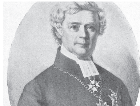
Henrik Reuter Dahl