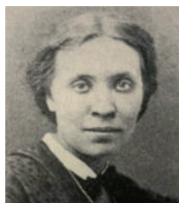
En ung Elfrida